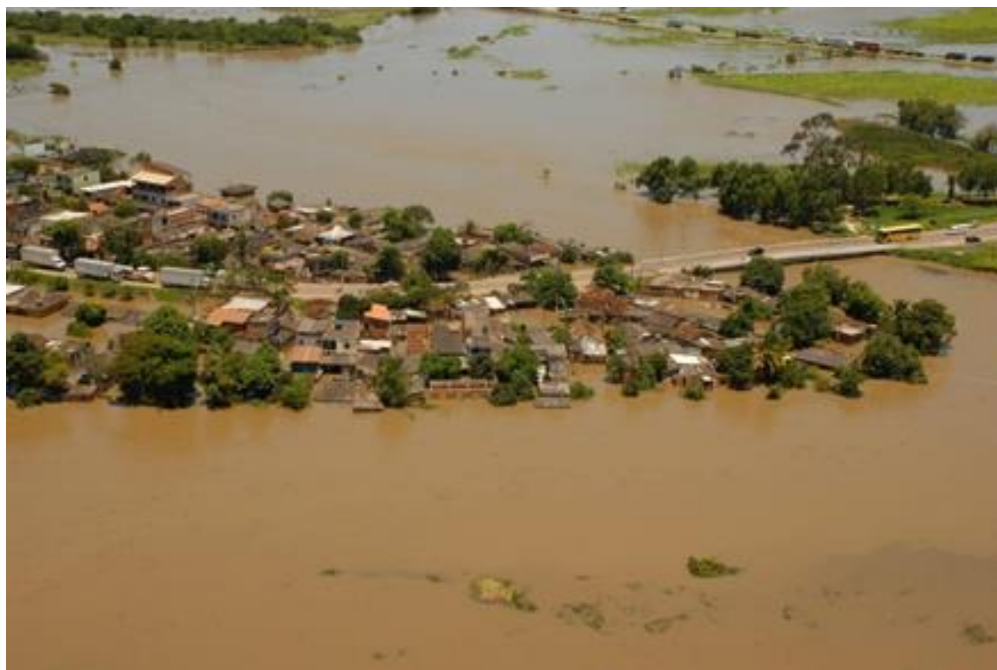
Fig. 2 – Foto aérea da inundação de Ururá em 2008, Campos dos Goytacazes (RJ), Brasil. Na imagem pode-se observar que muitas casas ficaram submersas e que as vias de acesso a sede do município, BR 101 e RJ 238, foram comprometidas.

Neste evento ocorreu uma precipitação atípica nas cabeceiras dos rios Imbé, Preto e Macabu que ocasionou uma inundação (fig. 2) de proporções até então não registradas, o qual afetou diretamente mais de 2.500 pessoas (NESA, 2016) no município de Campos dos Goytacazes, além de outras tantas de forma indireta, devido a obstrução e dificuldade de acesso nas principais vias. Segundo Malagodi e Siqueira, devido às características deste fenômeno, ele foi classificado como um desastre, e diferentes atores passaram a intervir naquele espaço, a exemplo da Defesa Civil municipal e do Ministério Público Estadual e Federal (MALAGODI & SIQUEIRA, 2012a, p.10).